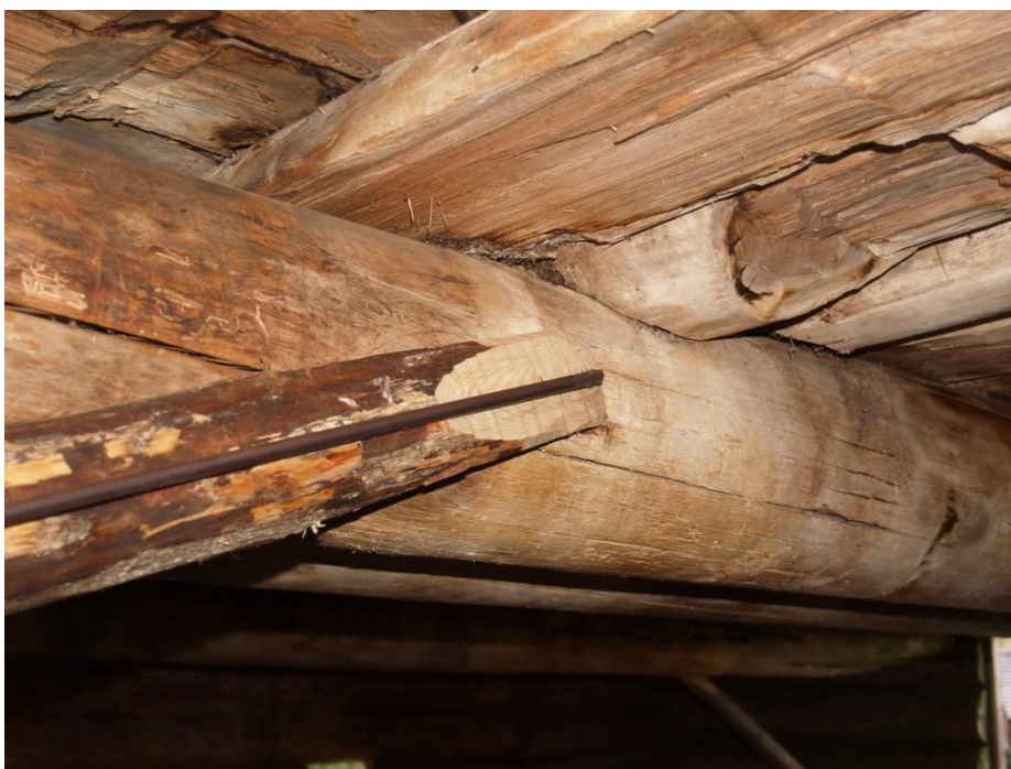
2020-10-08: Slutbesiktning Järnstaget har en vinklad ände med spets som har slagits in i bärlinan.