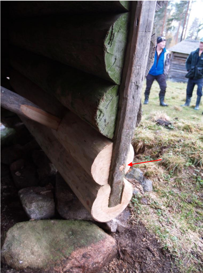
2020-10-08: Slutbesiktning Gåten har narats fast i timmerväggen.