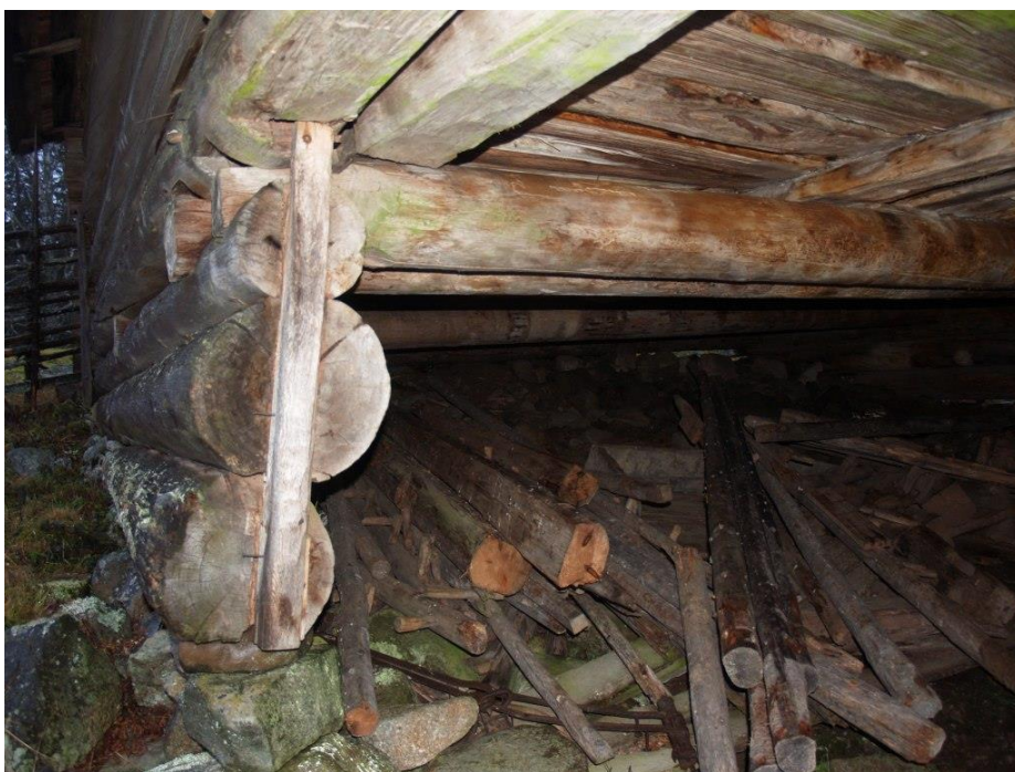
2019-11-22: En inhuggen gåt håller ihop ändarna men hela väggen viks ut.