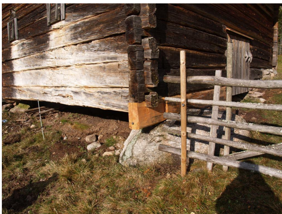
2020-10-08: Slutbesiktning Syllen har bytts ut till en grövre timmerstock.