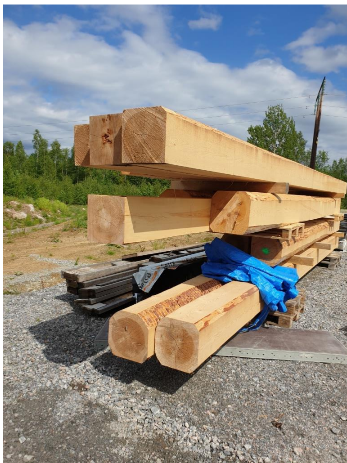
2020-06-09: Virket besiktades där det låg upplagt hos Lassas i Bollnäs.