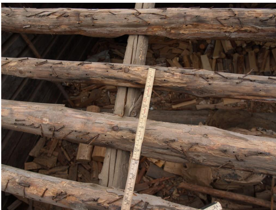
2020-09-15: Tron består av spräckt virke som ligger med 7":s distans.