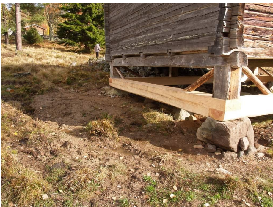
2020-10-08 : Slutbesiktning