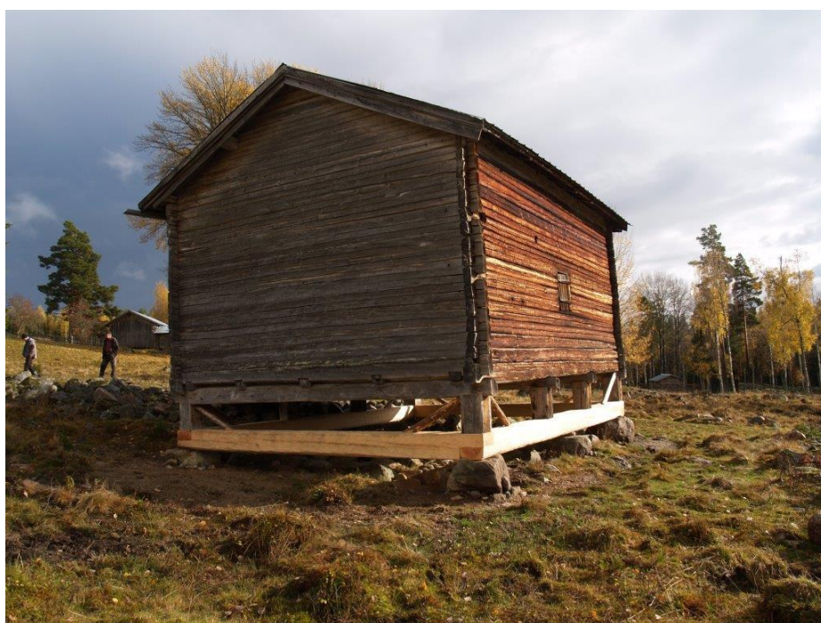
2020-10-08 : Slutbesiktning