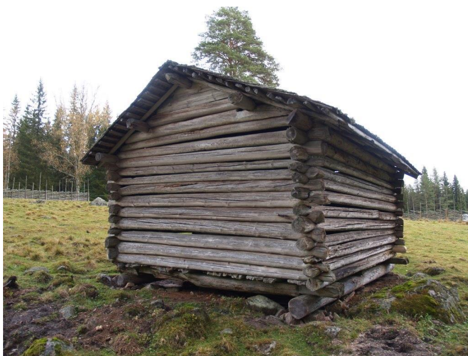
2020-10-08: Slutbesiktning Ladan efter avslutade arbeten.