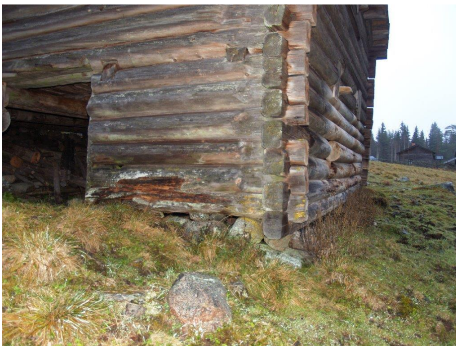
2019-11-22: Rundtimmerstockarna D1 och D2 hade rötskador och byttes ut när arbeten med grund och stomme ändå skulle göras.