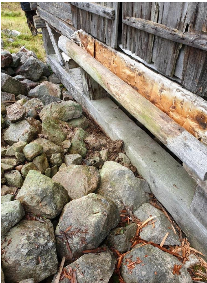
2019-08-14: På framsidan A stod ramen i jord och hade därför rötskador.

Uppkörsbron var borttagen vid fototillfället.