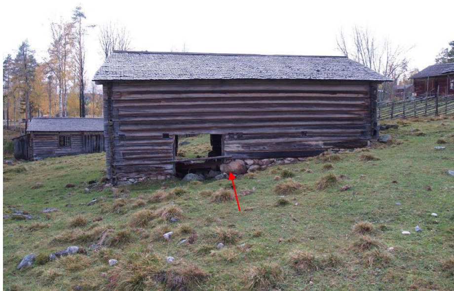
2020-10-08: Slutbesiktning Långsida B efter åtgärd. En större sten togs fram och lades in vid dörröppningen för att bromsa fortsatta rörelser. Marknivån sänktes genom grävning längs långsidan och stenvuren staplades om.