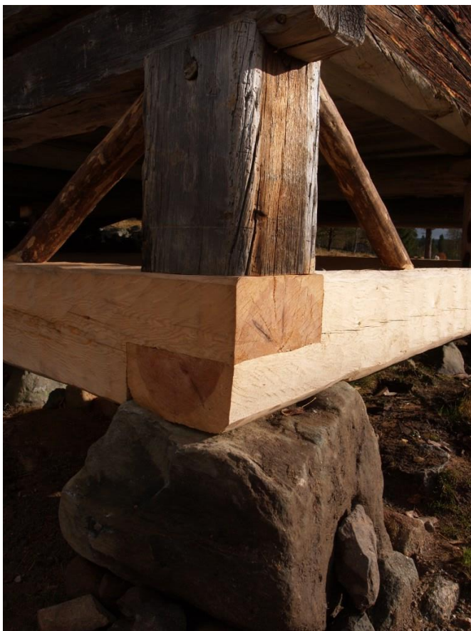
2020-10-08 : Slutbesiktning