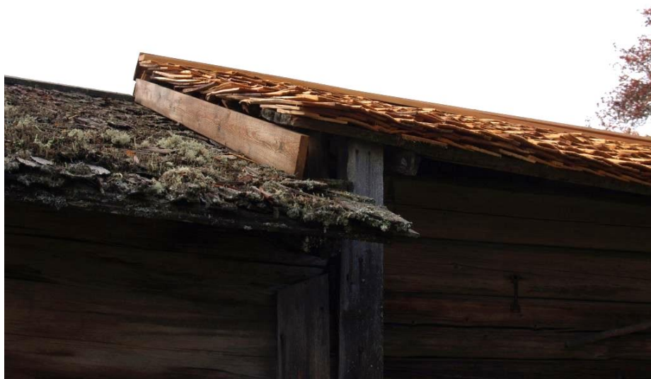
2020-10-08: Slutbesiktning Vindskivan vid stössets tak är nu möjlig att ta loss eftersom spånen inte är spikade i den.