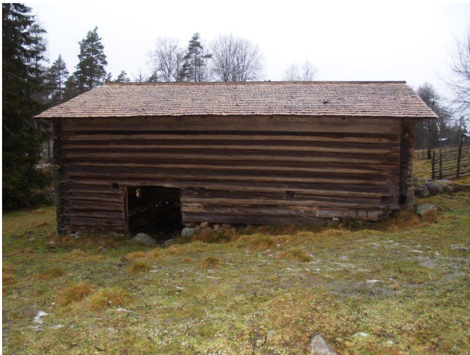
2019-11-22: Fäxet rör sig och glipor har uppstått mellan timmerstockarna samtidigt som stenstöden ramlat undan under syllarna.