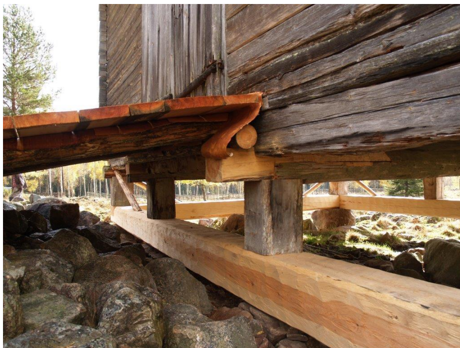
2020-10-08 : Slutbesiktning Ny uppkörsbro. Kärnan har vänts uppåt.