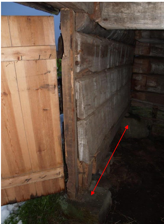
2019-11-22: Eftersom gåten ska göras ny skulle den kunna göras kortare och ställas i syllen, som får skjuta ut i stället för att stå på stenen och dra i sig fukt.