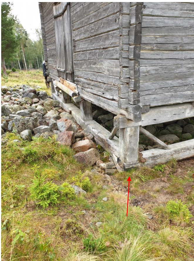
2019-08-14: I hörn DA var sillramen krossad.