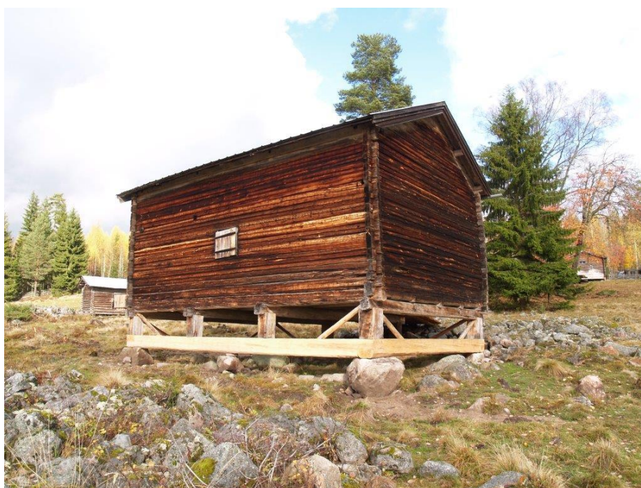
2020-10-08 : Slutbesiktning