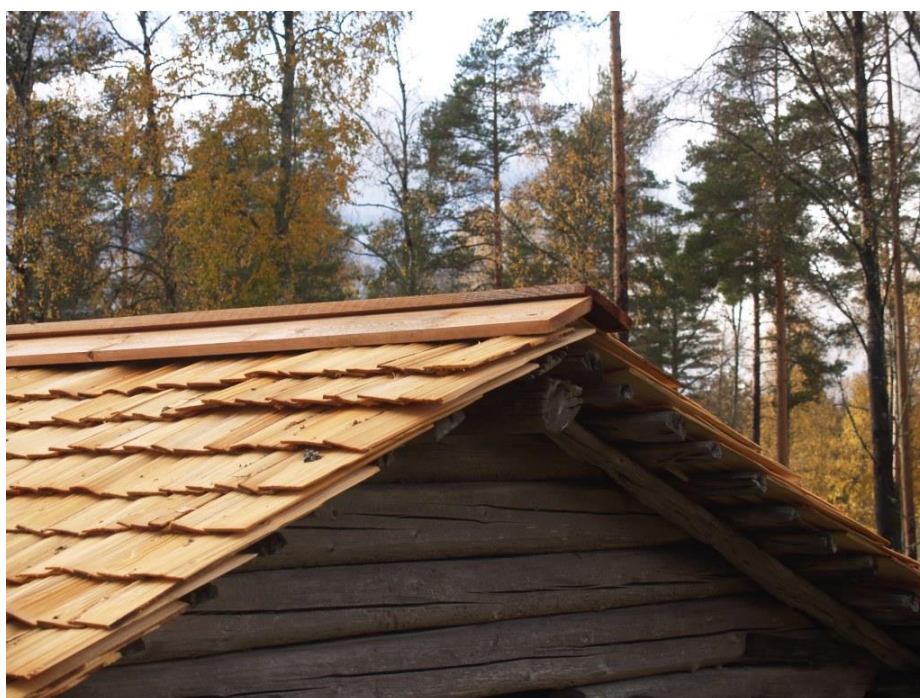
2020-10-08: Slutbesiktning Nya nockbrädor.