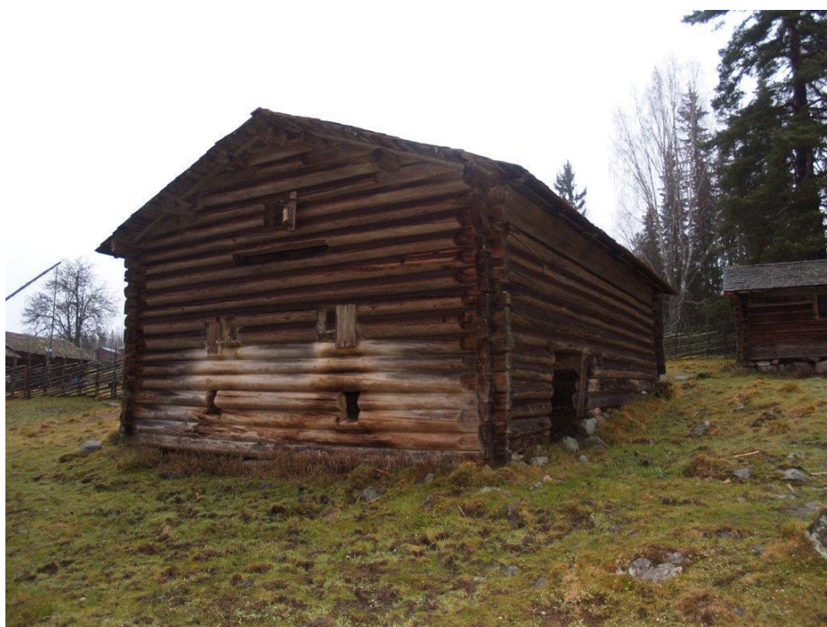
2019-11-22: Hagas fåx.