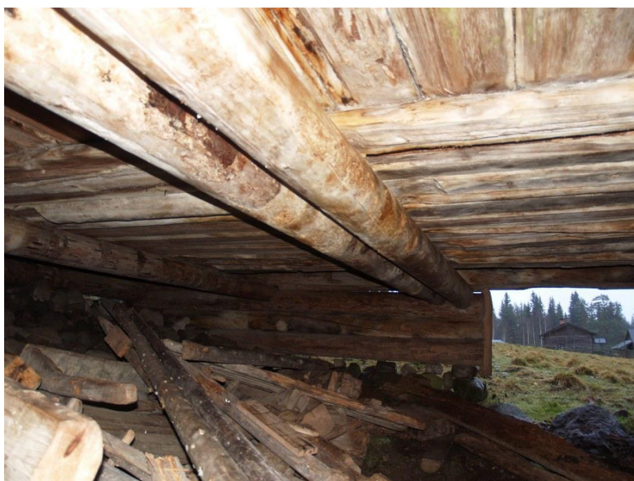
2019-11-22: Mellanbjälklaget sett underifrån.