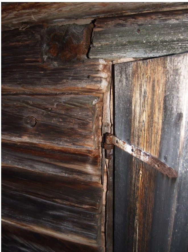
2019-11-22: Gångjärnshaken hade släppt eftersom virket i gåten gått sönder.