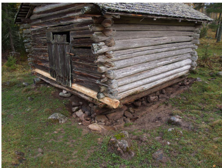
2020-10-08: Slutbesiktning En bredare stenkista har byggts upp under hörn DA för att möjliggöra fortsatta lyft och uppbyggnad av hörnstöden.