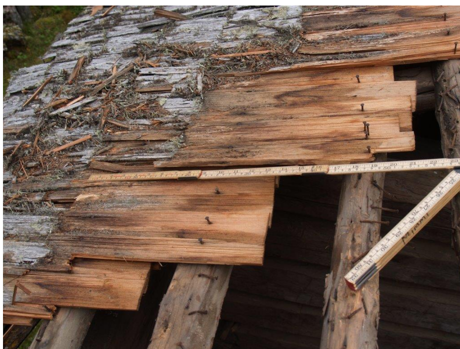
2020-09-15: Befintlig späntak lades 1976 av tidigare ägargeneration. Det var handspäntad furu. Virket var torraka tagen vid det egna skogsskiftet på Slummeråsen, Svartjärnsberget. Liggande stammar letades upp och togs hem för spåntillverkning. Spånet var 21", ca 54 cm långt, och låg i tre lager. Takfoten hade tvålagstäckning. Spånen var spikade från höger till vänster. Kärnan överlappade ytveden.