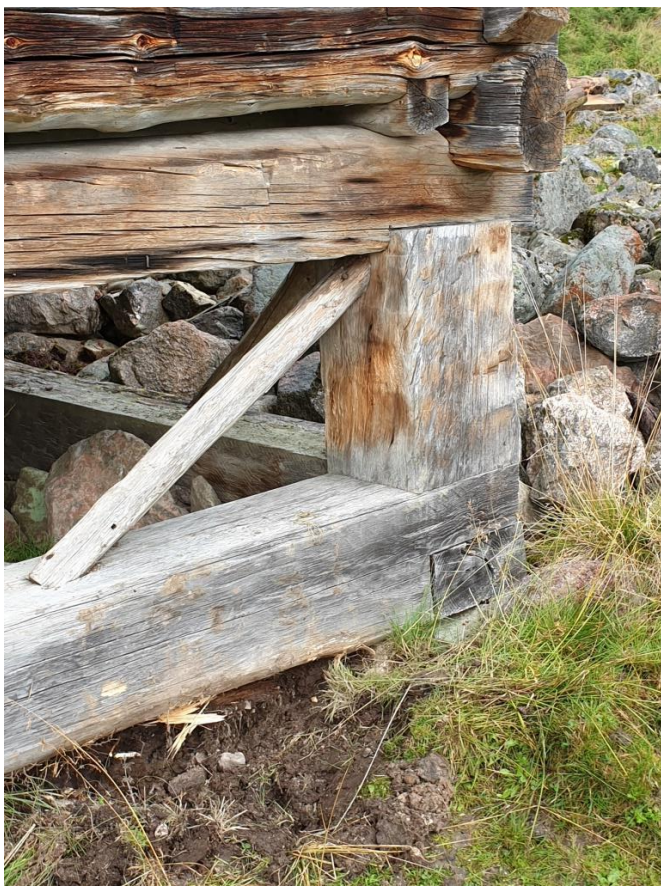
2019-08-14: Hörn AB stod på sten och har klarat sig bra.