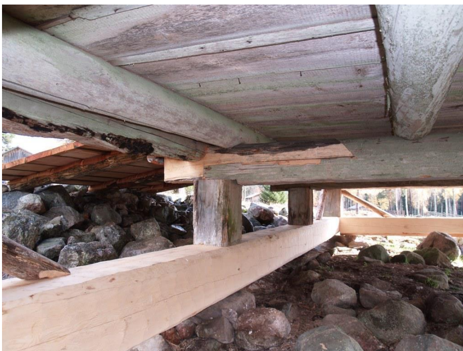
2020-10-08 : Slutbesiktning Skarv i bärlina. Skarven har fästs med genomgående trädymlingar som har kilats.