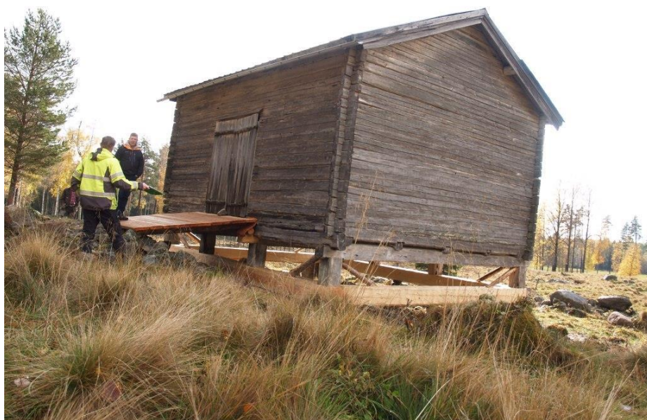
2020-10-08 : Slutbesiktning