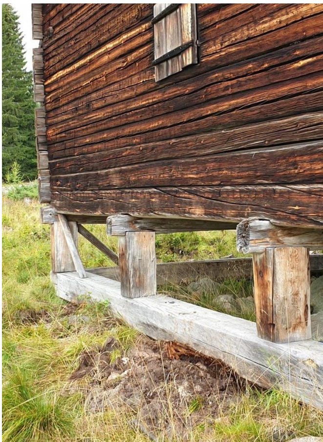
2019-08-14: Långsidan C stod i marken och har rötskador i undersidan.

Marken är mycket blöt runt logen och djuren trampar marken nära syllramen.