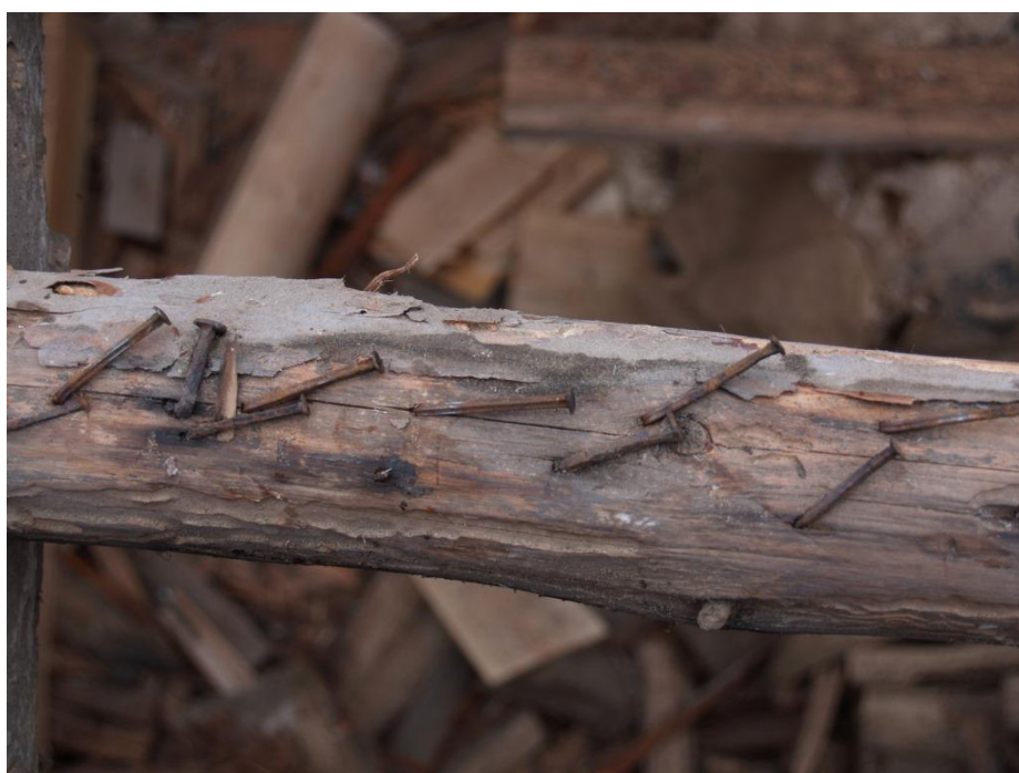
2020-09-15: Två lager trådspik kan ses men också rester av klippspik. Det är möjligt att det har legat tre generationer spån på taket och att vi nu lägger det fjärde.