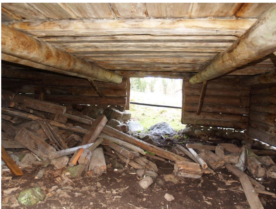
2020-10-08: Slutbesiktning Stagen på långsida B som ska hålla väggen på plats framöver. Öppningarna kommer att spärras av så att djuren inte kan gå in under fäxet.