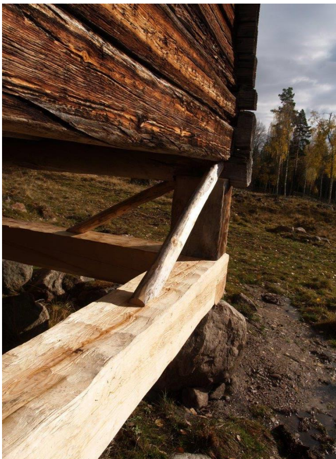
2020-10-08 : Slutbesiktning Inhuggna strävor stabiliserar hörnstolparna.