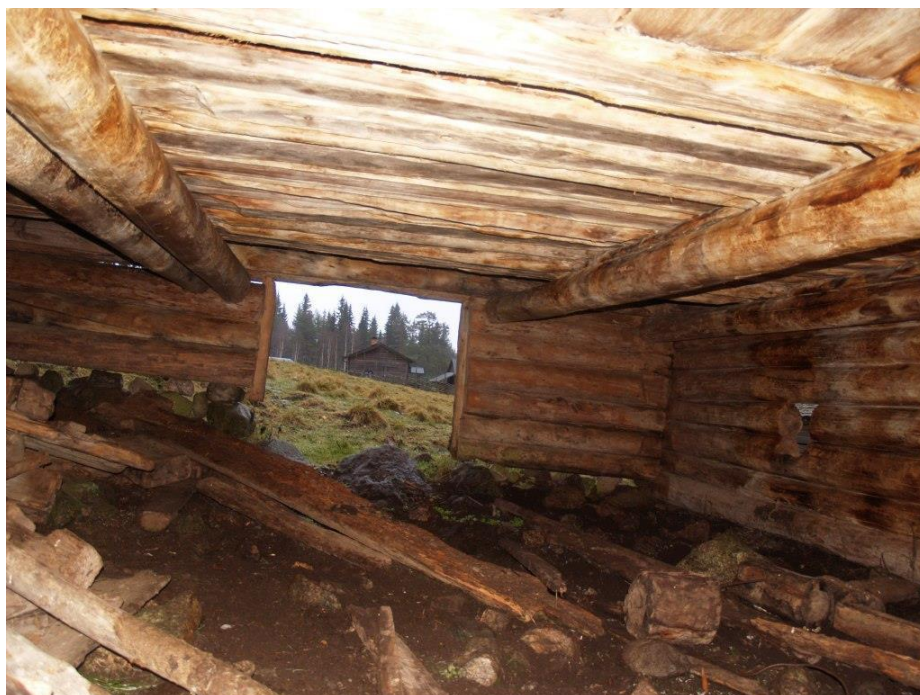
2019-11-22: Det är en svag konstruktion eftersom sammanbindande syll saknas och korna går in under byggnaden vilket tryckt ihop marken mot grundstenarna.