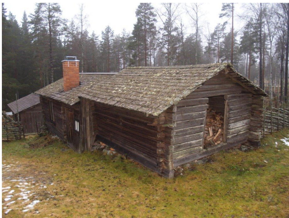
2019-11-22: Vedboden, det gamla rökstösset, var i behov av nytt spåntak.