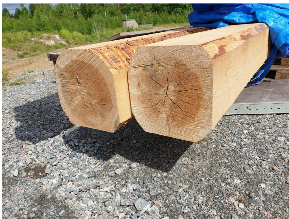
2020-06-09: Virket till syllramen avverkades i Kälarne, Jämtland.