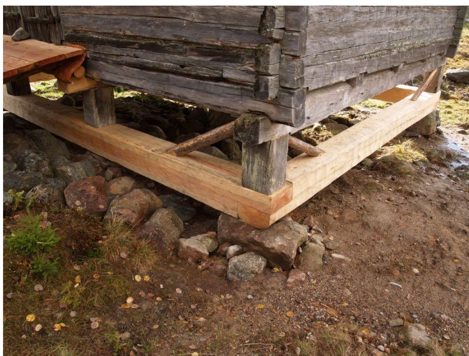
2020-10-08 : Slutbesiktning I hörn AB och DA har småsten innesluten i markduk grävts ned som bärlager. Ovanpå står nya grundstenar.