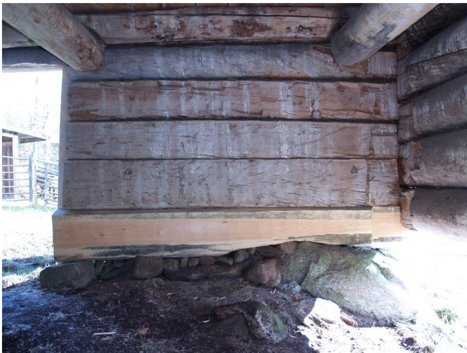
2020-10-08: Slutbesiktning Den utbytta stocken stämmer bättre i dimension med den befintliga väggen. Stocken är färsk och därför har det blivit viss blånad i ytveden men det påverkar inte hållbarheten.