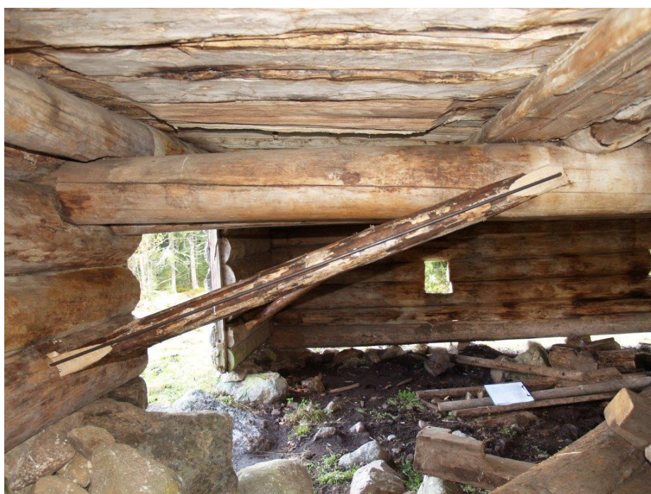
2020-10-08: Slutbesiktning Nya trästagg. Det gick inte att hitta en bra infästning för stagen som skulle klara dragkrafterna och därför tillfördes ett dragjärn parallellt med trästaget.