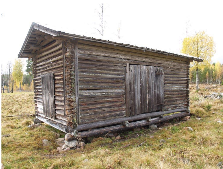
2020-10-08: Slutbesiktning Ladan har lyfts och placerats på nya hörnstöd.