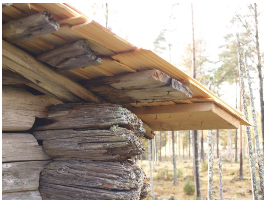
2020-10-08: Slutbesiktning I norra hörnet är spånet utdraget längre för att täcka den utskjutande knutkedjan. Trobrädan längst ned i takfoten har till del bytts ut och förlängts.