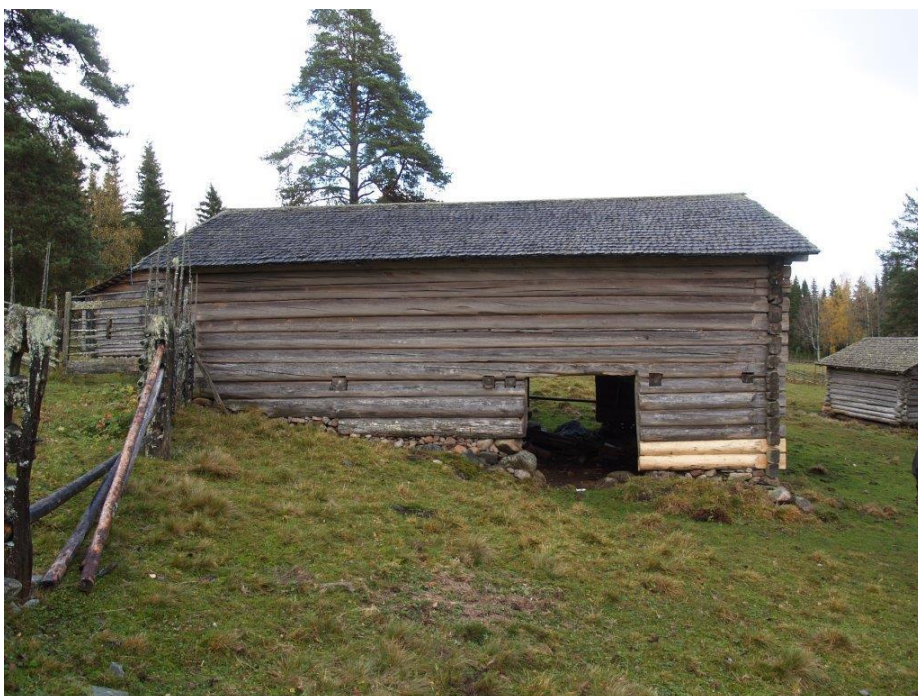
2020-10-08: Slutbesiktning Långsida D efter åtgärd.