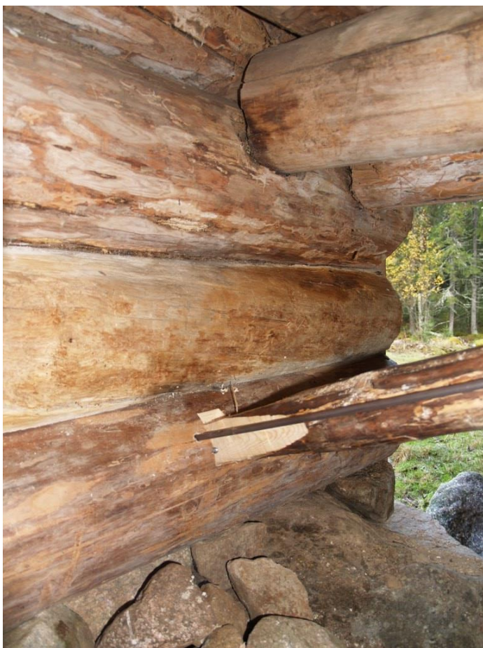
2020-10-08: Slutbesiktning Nedtill går järnstaget genom stocken via ett borrarat hål. På utsidan har järnet en u-form med spets som slagits in i stocken.