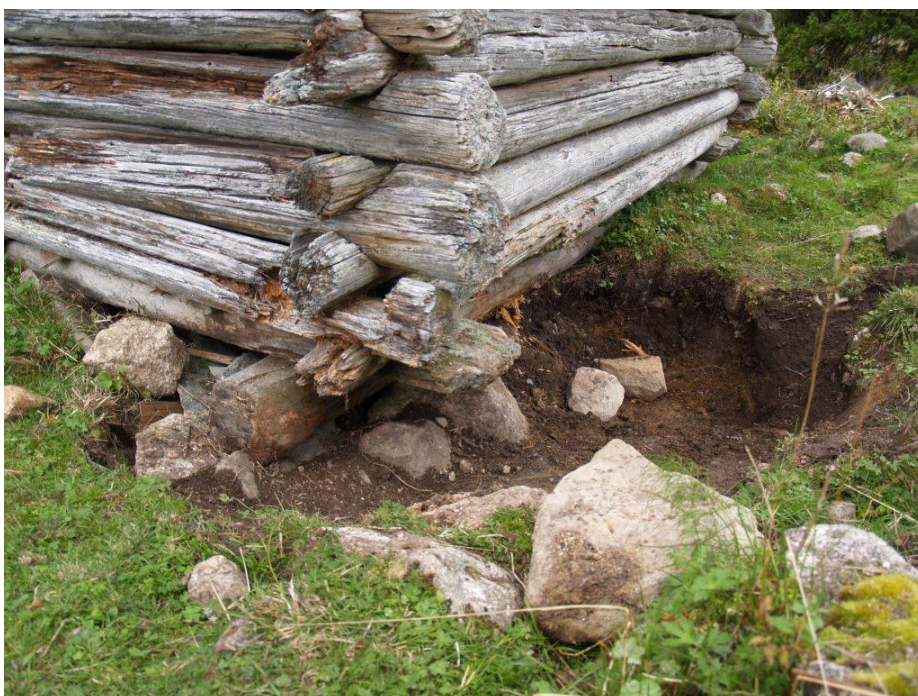
2020-09-15: Grunden på Hagas lada grävdes fram. Den stora stenen som stommen hängt upp sig på hade vid besökstillfället flyttats för att ingå i grunden under fäxet.