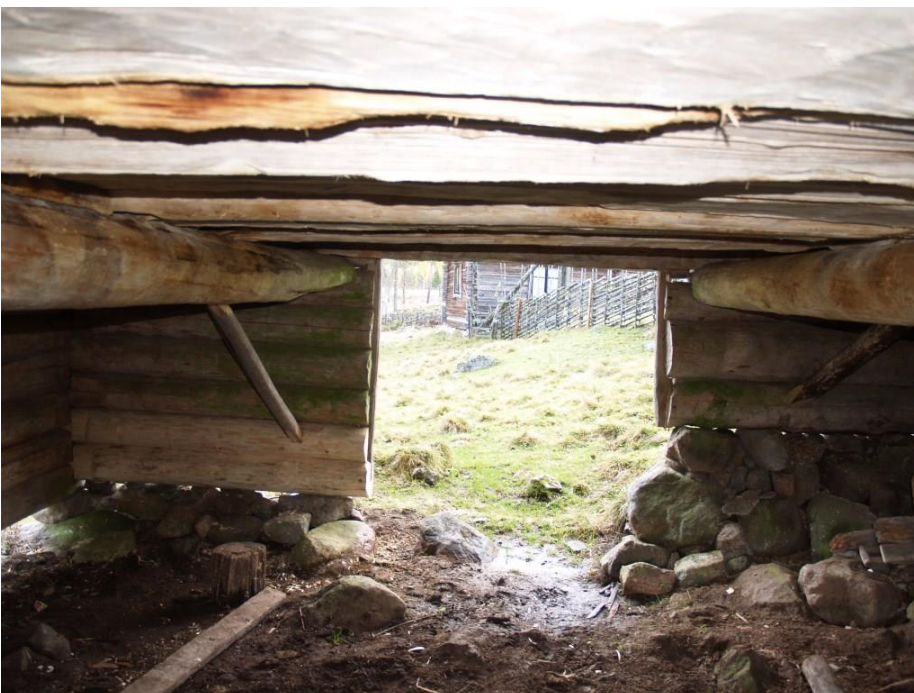
2020-10-08: Slutbesiktning Vägg D efter färdigställande.