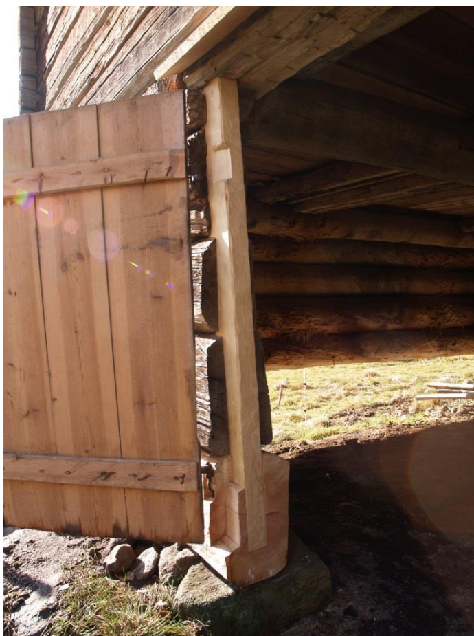
2020-10-08: Slutbesiktning Syllen förlängdes så att gåten nu vilar i stocken i stället för på stenen.