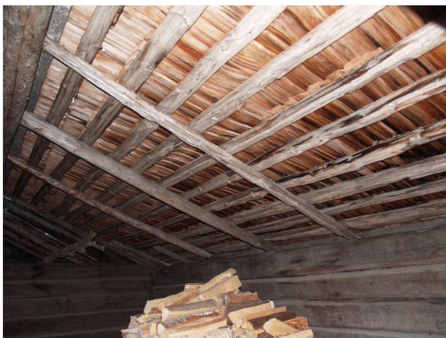
2019-11-22: På insidan syntes fuktgenomslag och svarta märken där rötan hade gått igenom spånen.