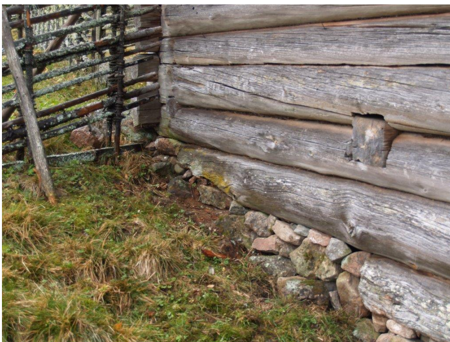
2020-10-08: Slutbesiktning Fåxets hörn DA har fått en översyn. Jord nära syllen har tagits bort och stenar lagts in under timret för att förhindra att fukt orsakar röta.