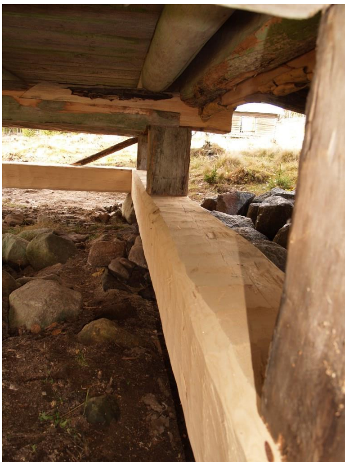
2020-10-08 : Slutbesiktning Skarv i bärlina.