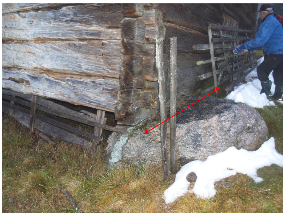
2019-11-22: Syllen skulle bytas från hörn BC fram till dörröppningen. Stommen vilar på en bra hörnsten.