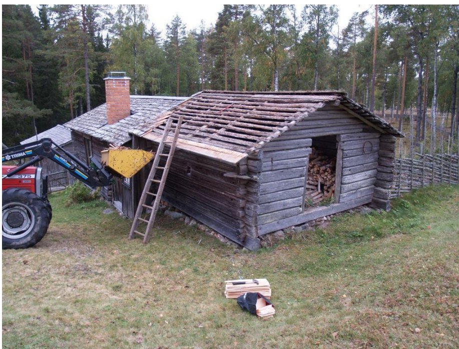
2020-09-15: Omläggningen av taket på vedboden, det f.d. rökstösset, under pågående arbete.