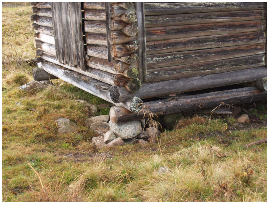
2020-10-08: Slutbesiktning En bredare bas av sten har byggts så att det går att ställa större hörnstenar på denna.