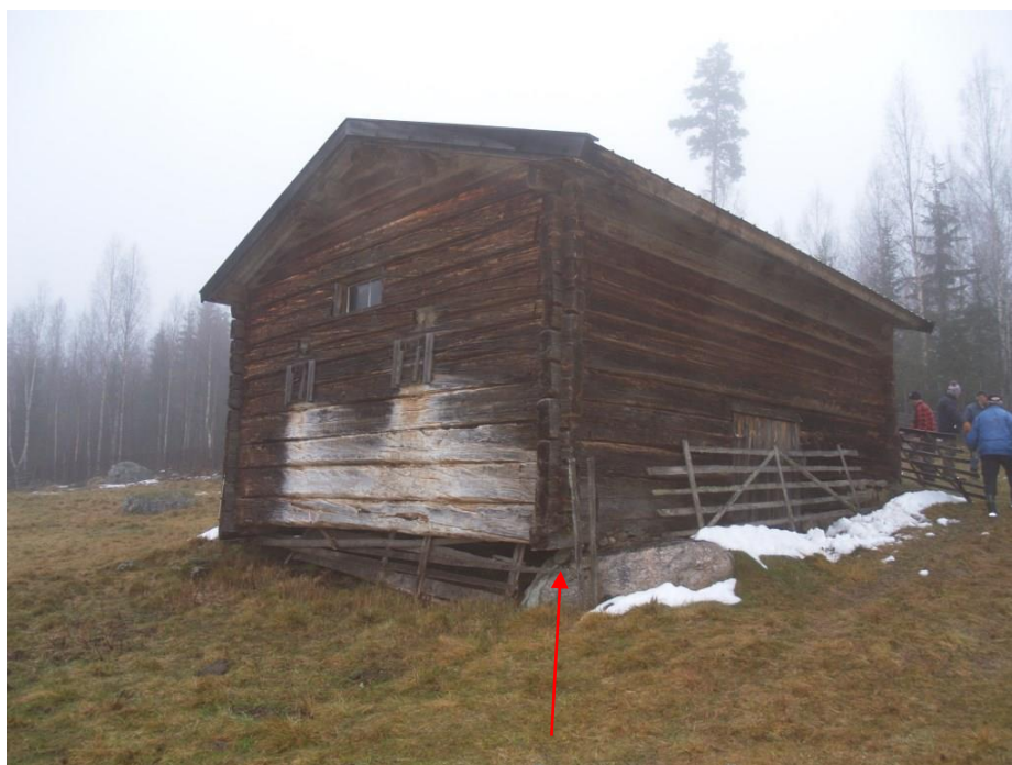
2019-11-22: Lassas fäx med hörn BC där syllen byttes ut.