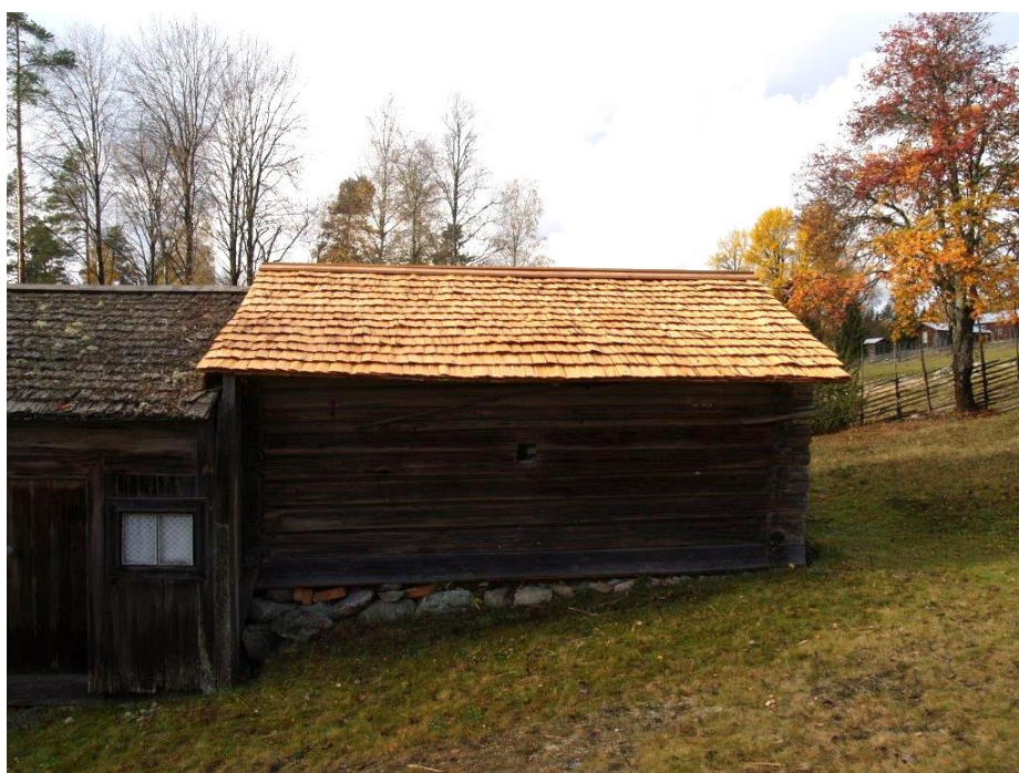
2020-10-08: Slutbesiktning Vedboden med nytt spåntak och nya nockbräddor.