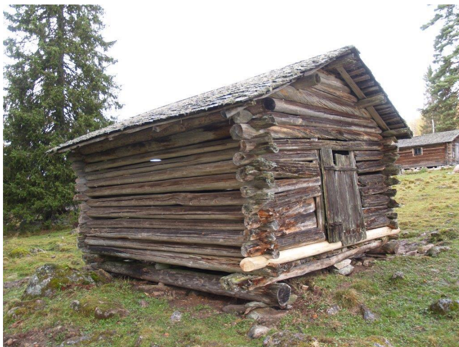
2020-10-08: Slutbesiktning Ladan har lyfts och rätats. Tröskelstocken har bytts ut.