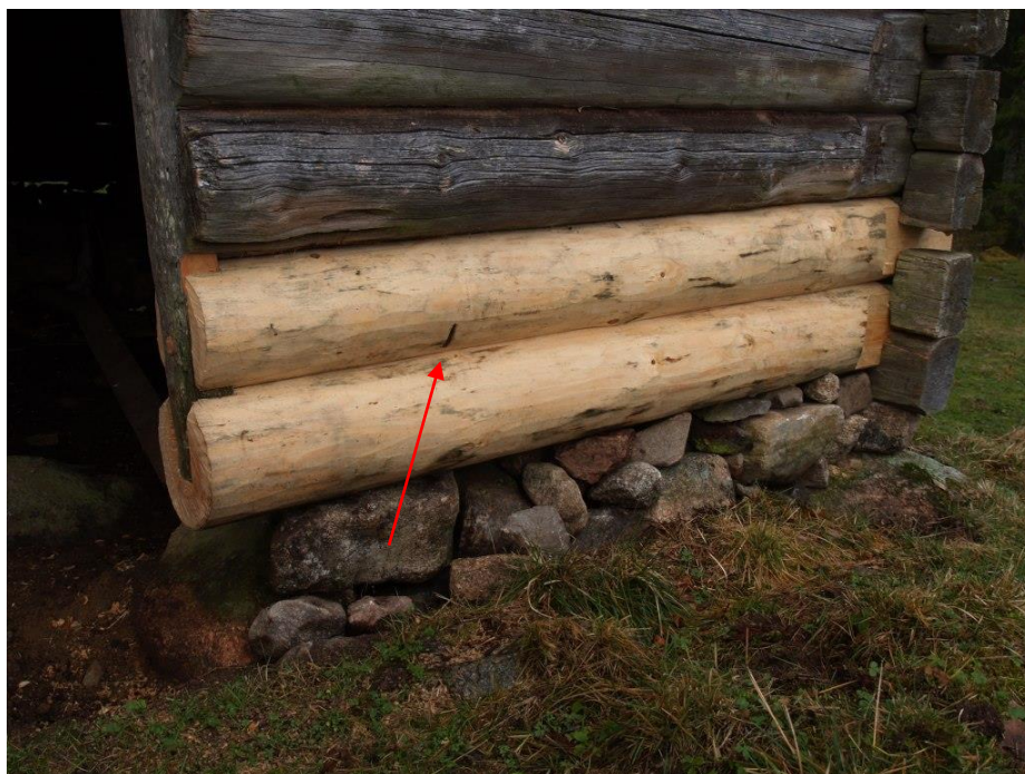
2020-10-08 : Slutbesiktning Vägstockarna D1 och D2 har bytts ut. Stengrunden har staplats om. I D2 syns järnstagets infästning.