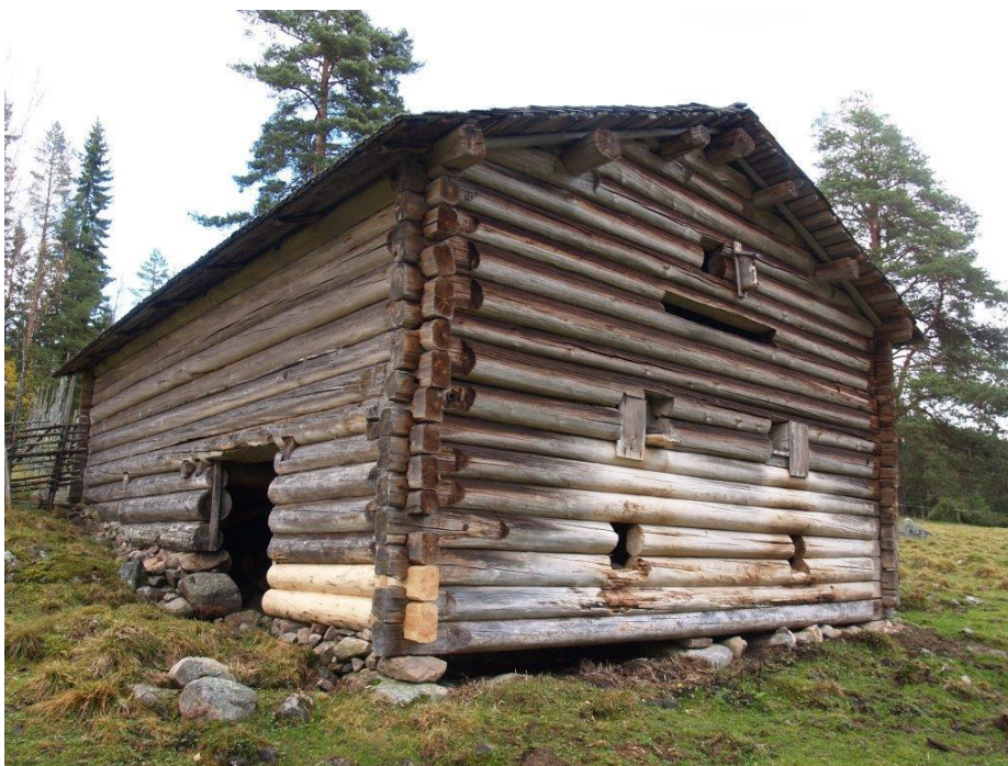
2020-10-08: Slutbesiktning Hagas fäx efter att stomme och grund har åtgärdats.