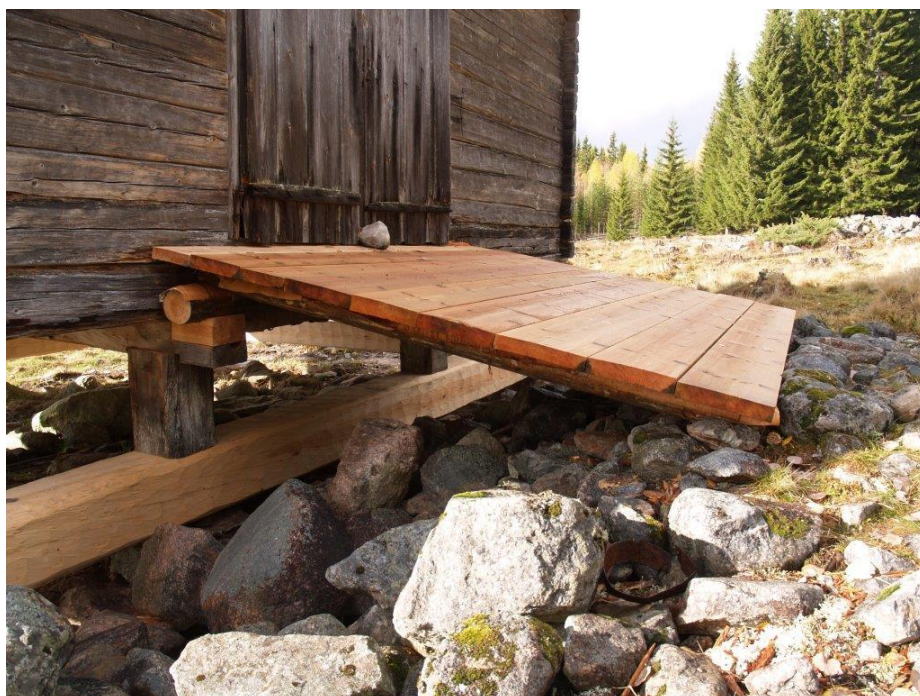
2020-10-08 : Slutbesiktning Stenraden närmast syllramen har rensats så att inget ska ligga mot virket.