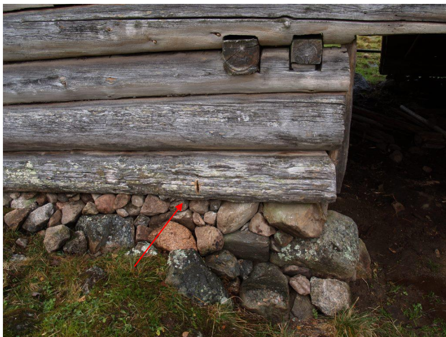
2020-10-08: Slutbesiktning Stengrunden har kompletterats efter att stommen dragits ihop. Järnstagets genomföring genom stocken har markerats med röd pil.