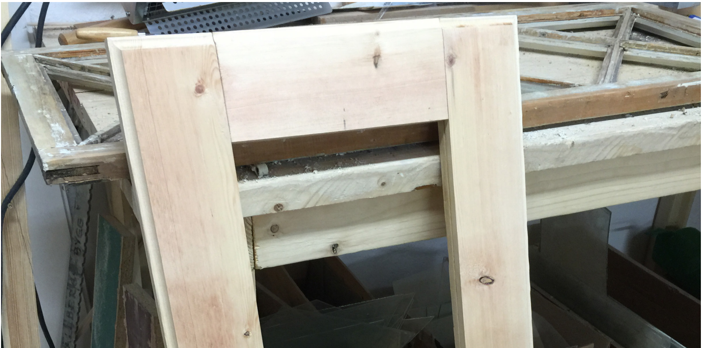
Tillverkning av fönsterbåge till ett gammalt vindsfönster.