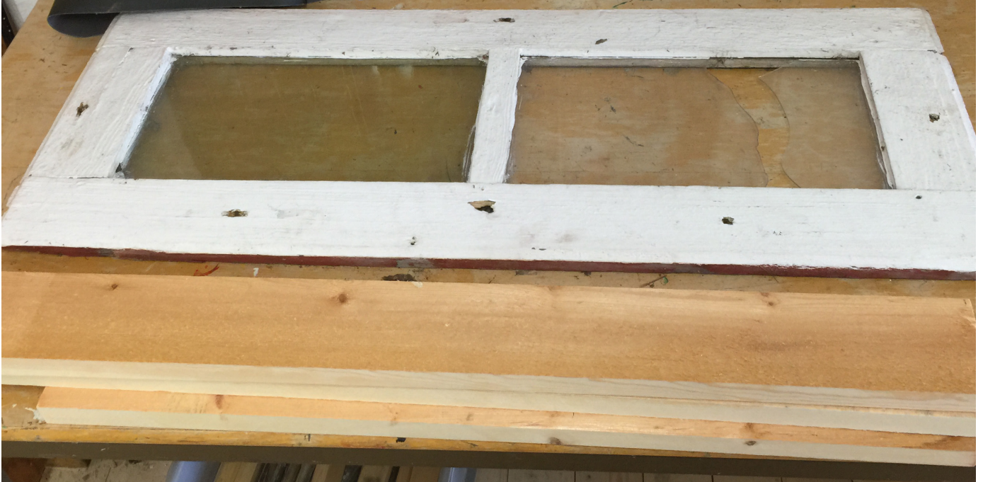
Ett fönster som ska renoveras.