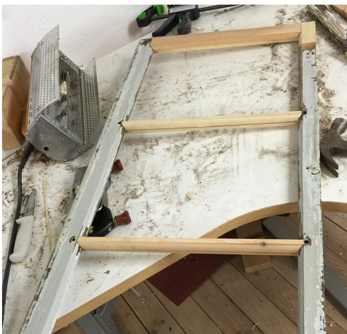
En båge håller på att sättas ihop med nya delar.