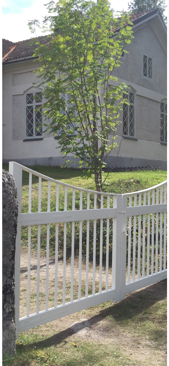
Nyrenoverade grindar på plats.