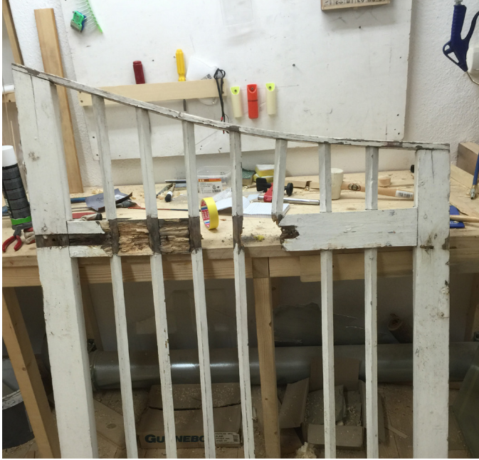
En grind som är kraftigt rötskadad och en ny ska tillverkas med den som förlaga.