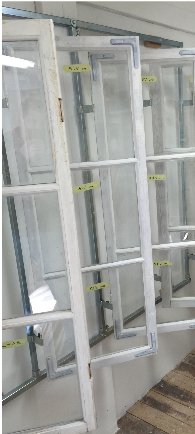
Fönsterbågar på torkning efter målning med linoljefärg.