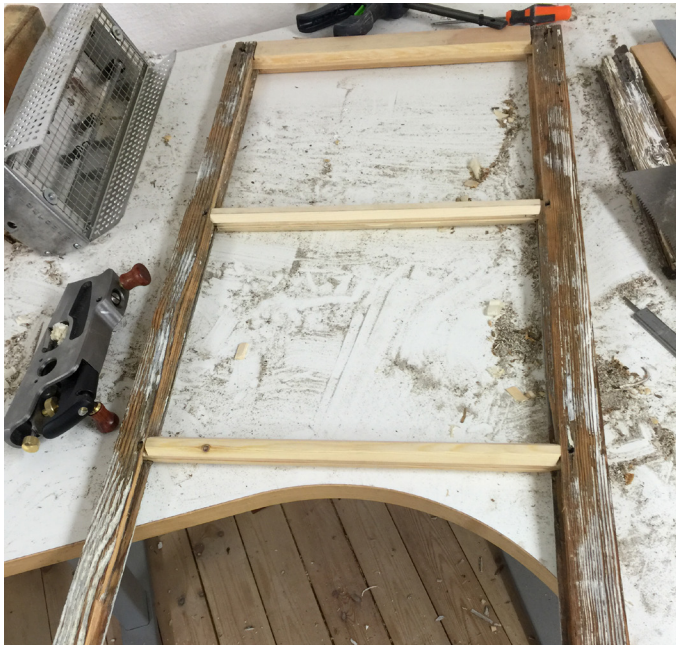
En fönsterbåge med två nya spröjs och ett nytt bottenstycke.