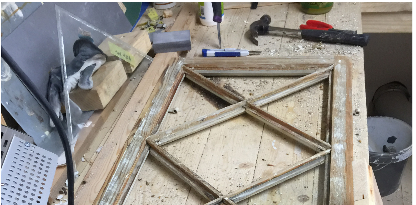
Ett vackert fönster som rengjorts inför oljning med linolja.