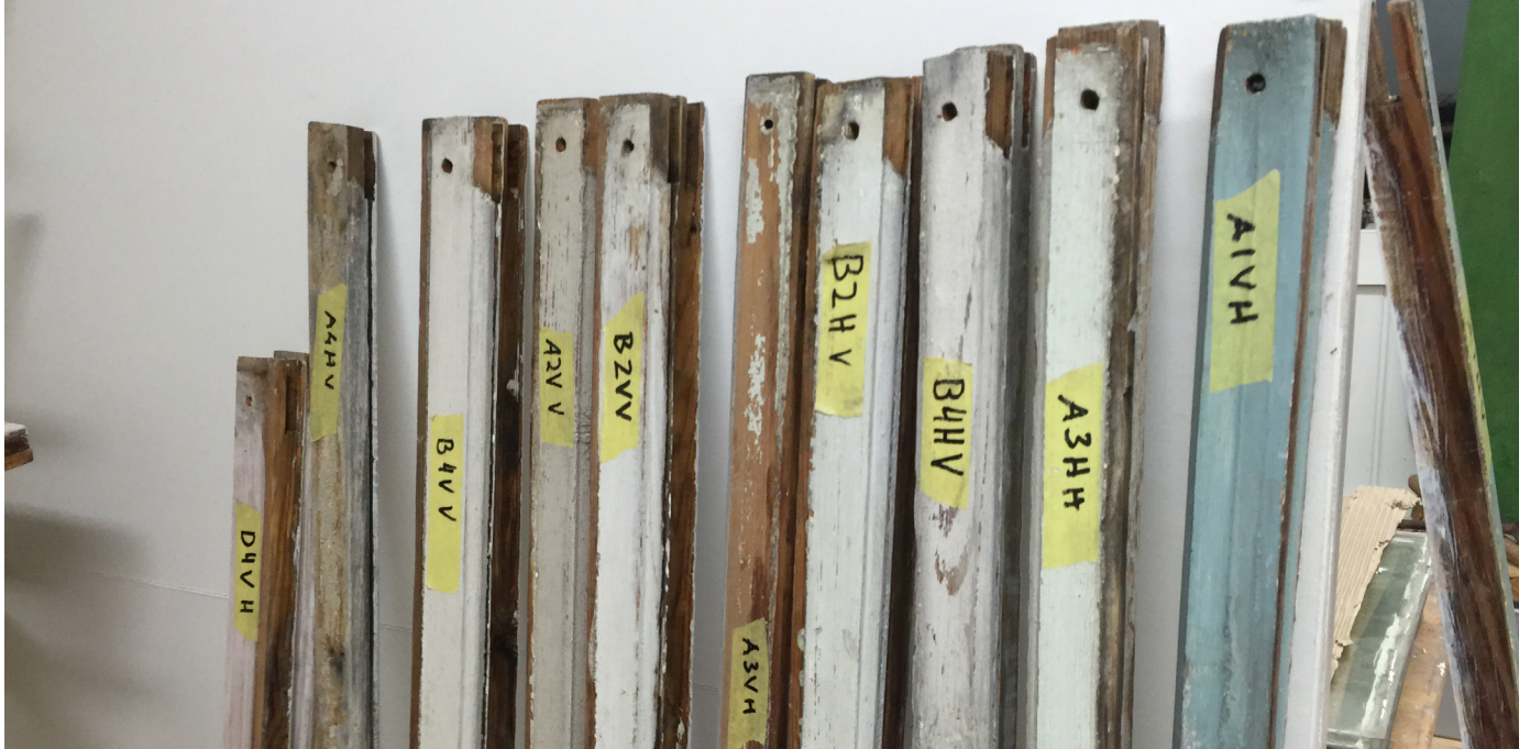
Delar till fönsterbågar som ska renoveras.