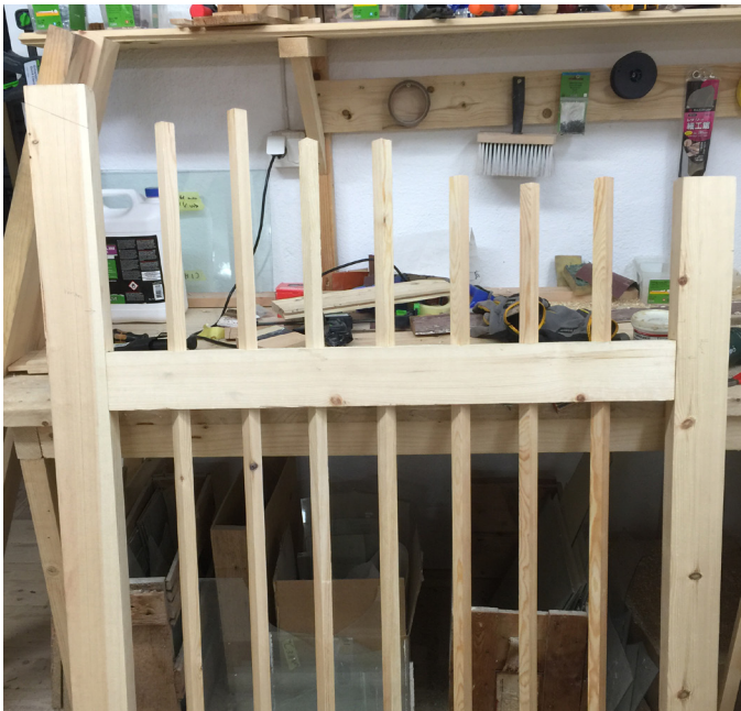
Den nya grinden tillverkas av furu med hög kvalitet.