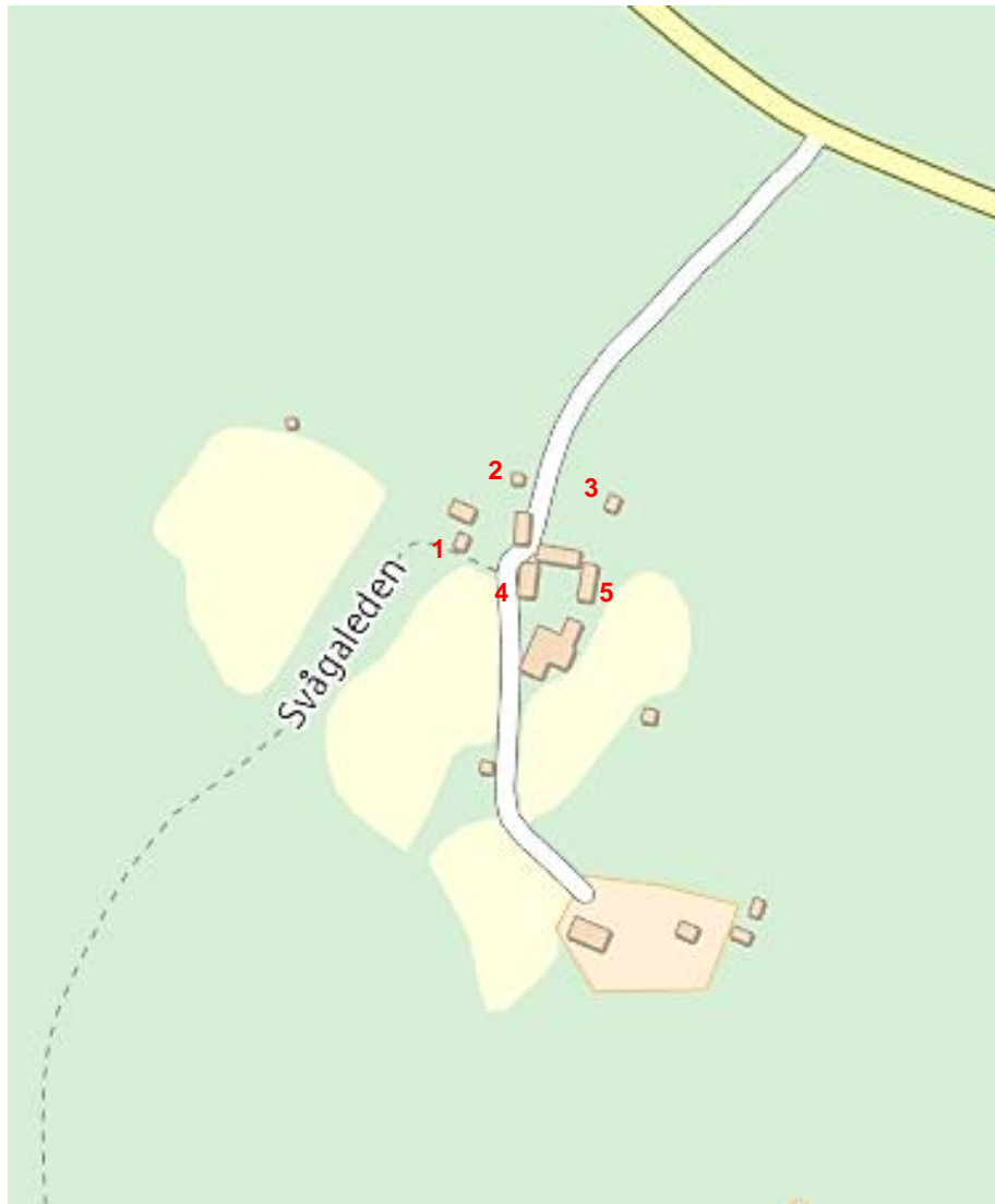
Figur 1. Ersk-Matsgården samt arrendatorsgården Ny-Ersk-Mats. Den gula vägen i kartans nordöstra hörn är landsvägen mellan Hassela och Torpshammar. Utdrag ur cX-kartan. Följande byggnader har omfattats av renoveringsåtgärder 2016 och numrerats på denna karta: 1. Vagnslidret, 2. Härbret, 3. Bastun, 4. Stallet, 5. Bostadshuset "Yst på gården".