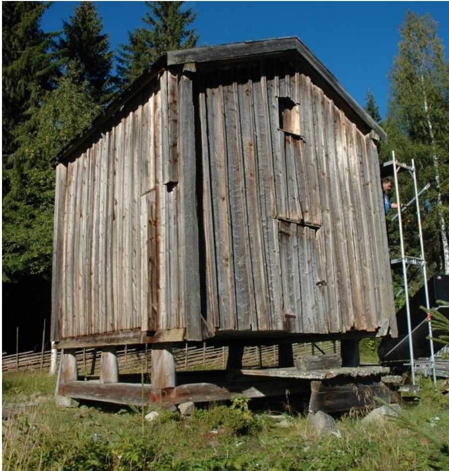
Figur 9. Härbret från sydväst innan reoveringen hade inletts. Längs den västra fasaden har uppförandet av byggnadsställningar påbörjats.