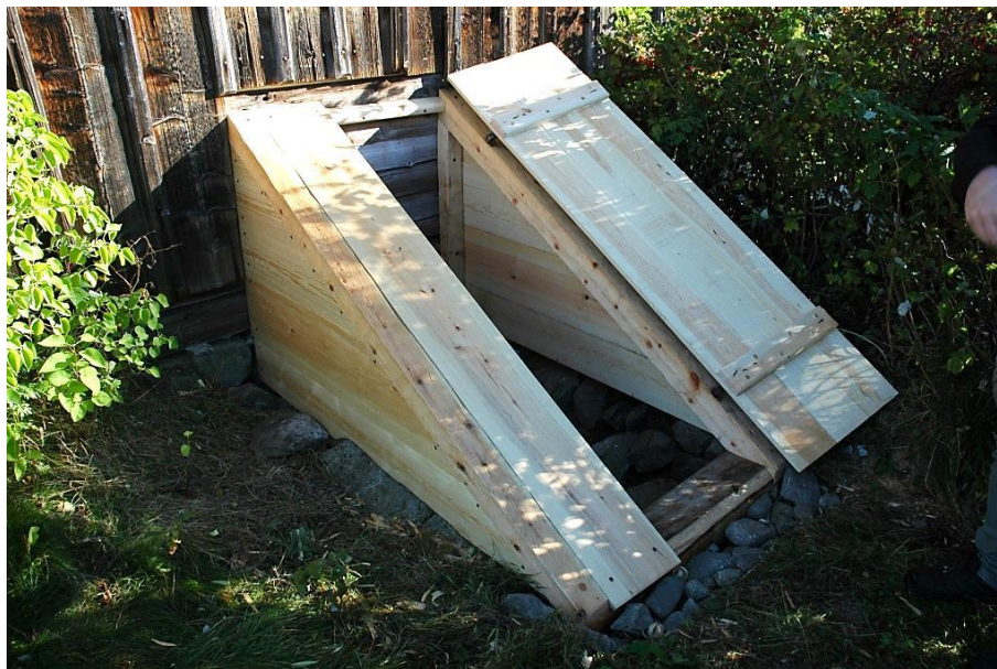
Figur 18. Källarsvalen vid "Yst på gårdens" södra gavel efter rekonstruktionen. Foto från sydväst.

trycket som fanns på denna ås. Den bärande stenstolpen har satts om genom omläggning av de befintliga stenarna så att den inte längre lutar åt en sida. Timmerväggen mot väster har dock inte lyfts.