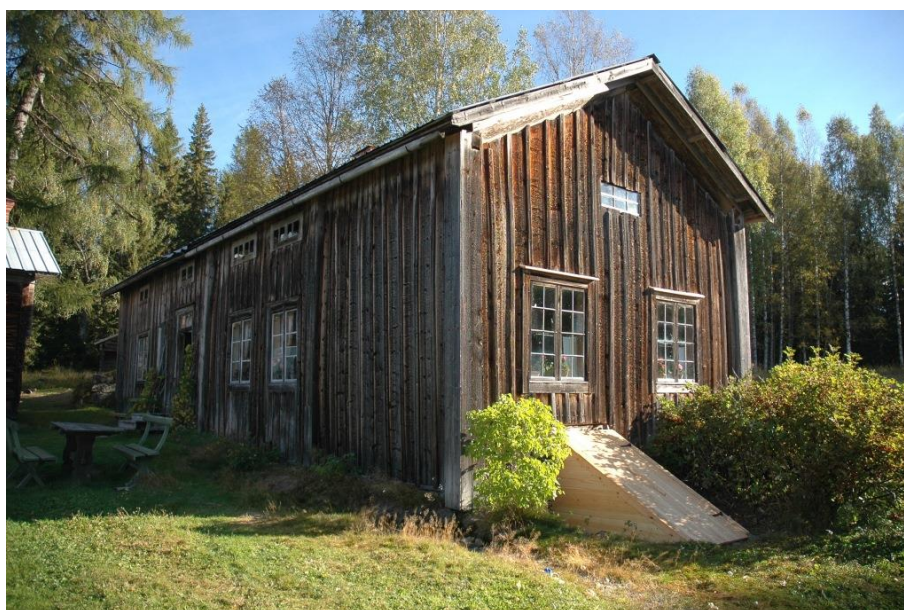
Figur 19. "Yst på gården" efter avslutad renovering.

Renoveringsbehovet för de tre ladorna inom byggnadsminnets område har studerats separat. Läns museet har tidigare framfört att det vore önskvärt att på sikt återuppföra den nedrasade höghässjan samt fastbandhagarna över de öppna markerna sydväst om gården då de är viktiga för upplevelsen av gårdsanläggningen.