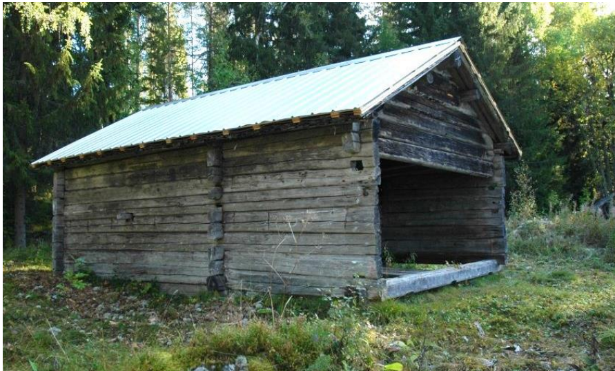
Figur 16. Bastun från sydväst efter avslutad renovering.

tak av galvaniserad pannplåt. Härbrets gavlar har försetts med nya vindskivor med en höjd av 300 mm.