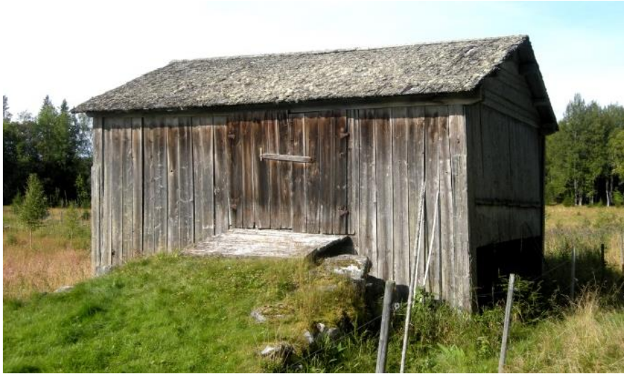
Figur 4. Vagnslidret från öster innan renoveringen.