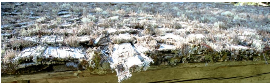
Figur 10. Detaljbild av bastuns västra takfall.

En timmerstock ovanför bastuns port hade kommit ur läge. Spåntaket var övervuxet med mycket mossa och i väldigt dåligt skick.