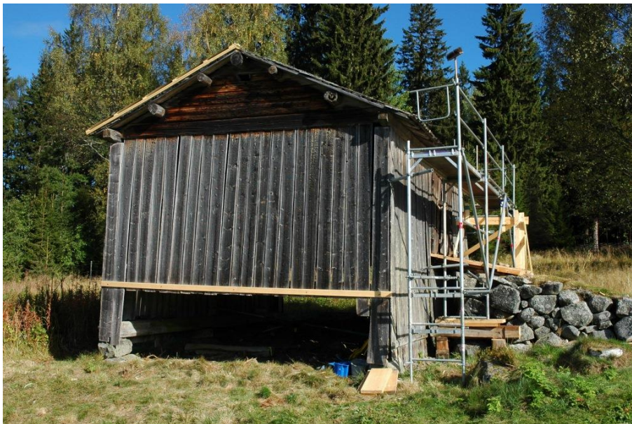
Figur 13. Vagnslidret från söder under renoveringen. 2016-09-05.

ytterkant. Den mittersta stolpen bör dock vara under fortsatt uppsikt för att i tid upptäcka eventuella framtida rörelser i konstruktionen. Lassas byggnadsvård har därtill riktat den sydöstra väggen och stabiliserat stommen genom att sätta in några snedsträvor under och i vagnslidret. Inuti byggnaden har även den nedramlade åsen, vilken ej var bärande, satts tillbaka på ursprunglig plats.