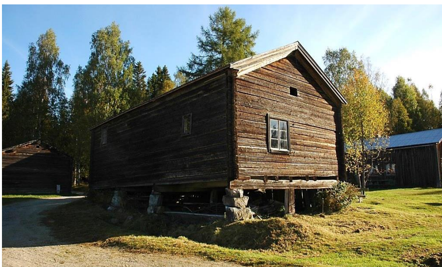
Figur 7. Stallet från sydost.

Enligt den denrokronologiska analysen som utfördes år 2001 uppfördes stallbyggnaden av virke som fälldes 1853. Byggnaden, som vilar på sten- och trästolpar, är knuttimrad och nås via ett stallslider med ingång från gårdsplanen. Stallet har sadeltak täckt med pannplåt. Norr om stallslidret finns en snickarbod och ovanpå denna en pigkammare utan eldstad. Söder om stallslidret finns ett