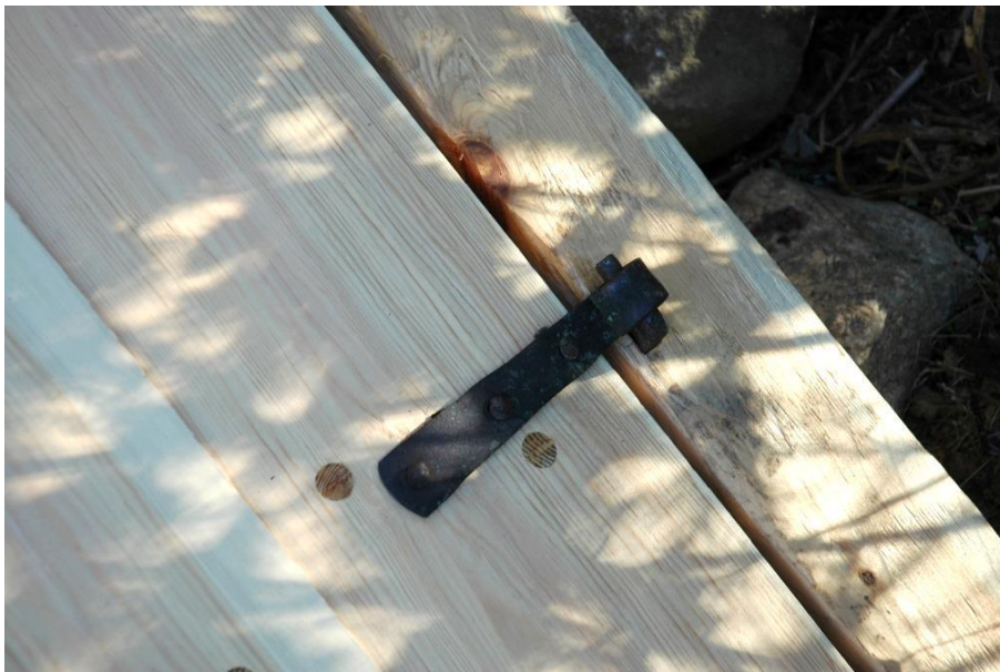
Figur 20. Detalj av dörren i källarsvalen söder om "Yst på gården" som är sammanfogad med tränaror och försedd med återanvända gångjärn.

genomgående varit av god kvalitet och sammanfogningar har som tidigare utförts med tränaror eller i första hand med återanvändande av ursprungliga järndetaljer.