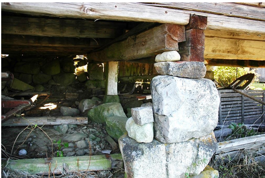
Figur 17. Detalj av åsarna under stallet efter renoveringen. Jämför med figur 11.

Den stock ovanför byggnadens port som hade kommit ur läge har satts fast och fixerats med en sträva av trä. Mossan på yttertaket sopades och revs bort varefter taket försågs med läkt, masonit samt strö- och bärläkt som underlag till ett nytt tak av galvaniserad pannplåt. I likhet med tidigare har denna byggnad inga vindskivor och vattbrädor och heller inga hängskivor längs långsidorna.