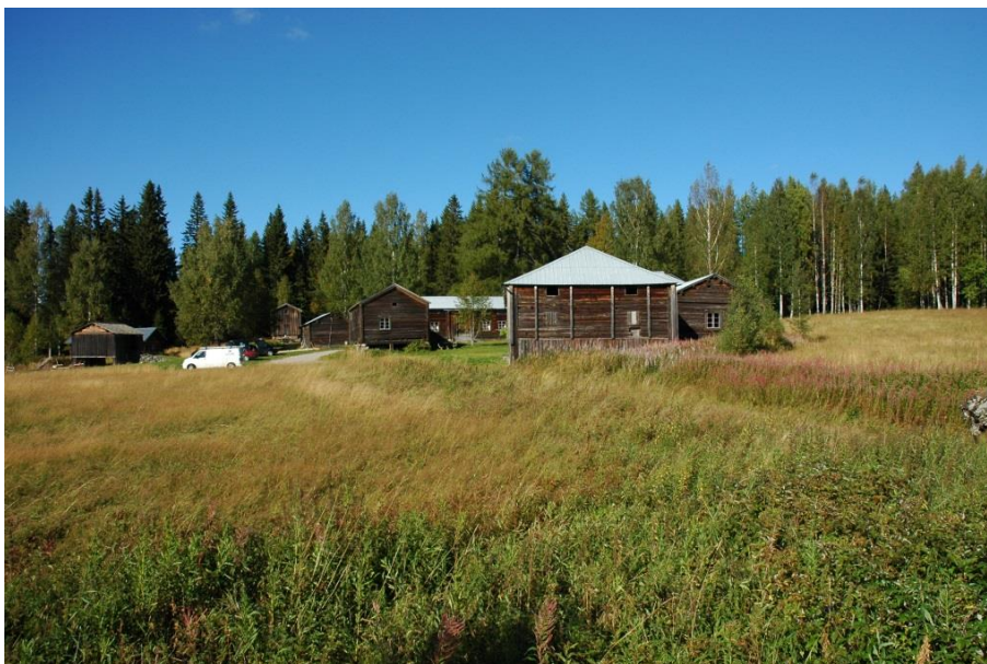
Figur 2. Ersk-Mats från söder. Från vänster ses vagnslidret, sommarladugården, härbret, vedboden, stallet, bostadshuset "Norr på gården" samt ladugårdskomplexet.