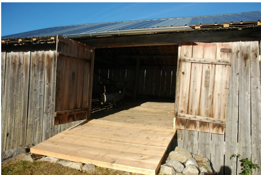
Figur 14. Vagnslidret efter tillverkning av ny körbrygga av trä samt byte av takmaterial.

Den sydvästra panelen har spikats åt och kompletterats med några nya brädor av samma utförande som de befintliga. Den sammanhållande utanpåliggande brädan längst ned byttes ut mot en ny av samma dimension och utförande som den tidigare. Den är som tidigare fastsatt med träpluggar samt återanvända järnmärklar. Den rötskadade träbryggan har ersatts med en ny av friskt virke av samma dimension och utformning med två bärande åsar under. Mellan trävirket och stenkonstruktionen ligger ett lager med näver.