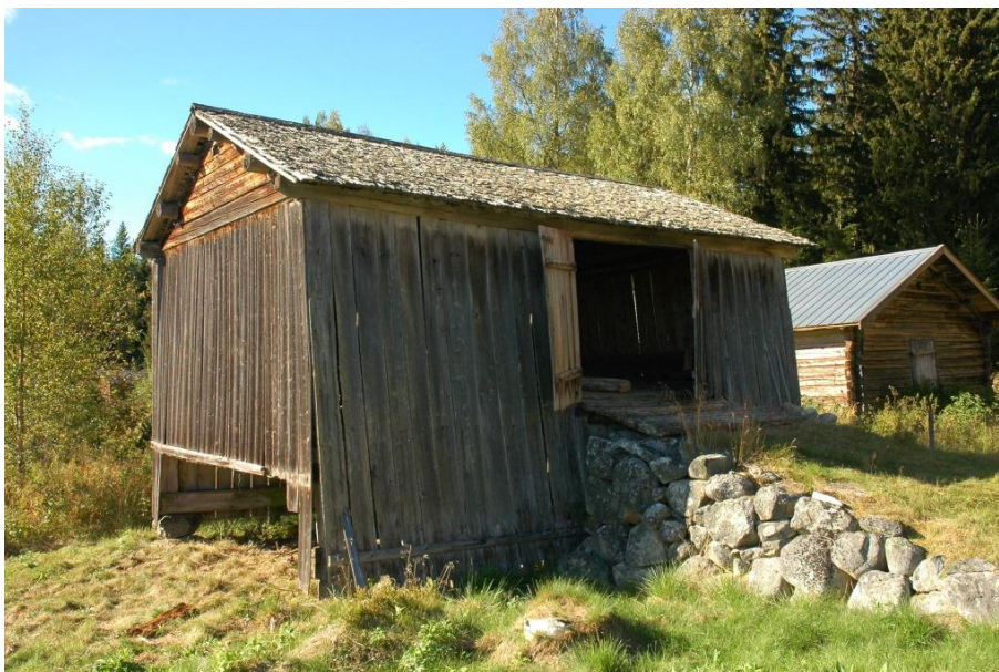
Figur 8. Vagnslidret innan påbörjad renovering.

Här nedan redovisas enbart de skador som har åtgärdats vid renoveringen hösten 2016.