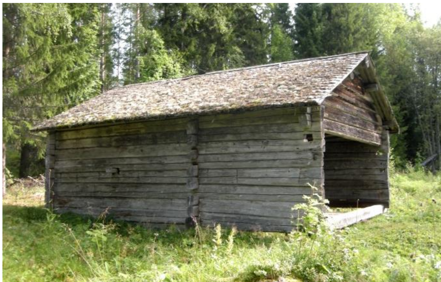
Figur 6. Bastun innan renoveringen.