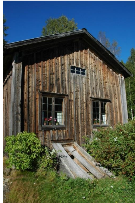
Figur 12. "Yst på gårdens" södra gavel samt källarsvalen.