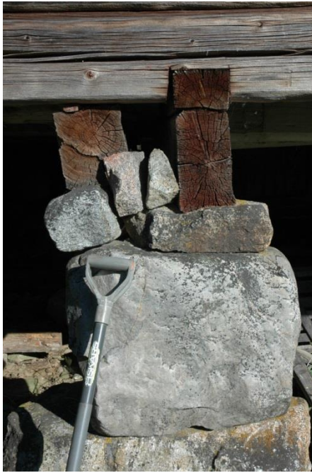
Figur 11. Detalj av bärande åsar och stenpelare under stallbyggnadens västra fasad.